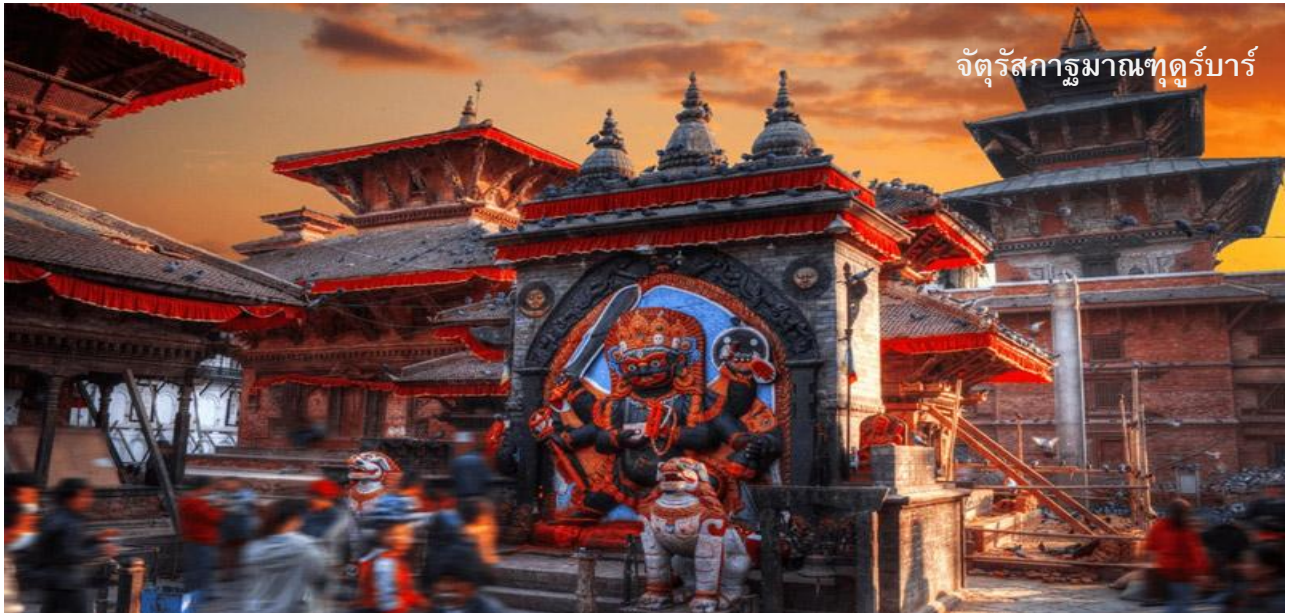
จัตุรัสการูมาลทศูร์บารี

คำ นำท่านรับประทานอาหารค่ำ พร้อมชมการแสดงทางวัฒนธรรมของชาวเนปาลี ลิ้มรสอาหารพิเศษ โม โม เกี่ยวซ่าเนपालแท้ๆ ณ ภัตตาคารพื้นเมือง ที่มีชื่อเสียงสำหรับนักท่องเที่ยวแห่งหนึ่งของประเทศเนปาล